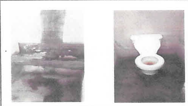
Foto 3: Remodelacion de baños existentes (Pintura, mantenimiento de puertas)