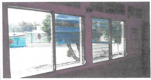
Foto1: Cambio de ventanas PVC